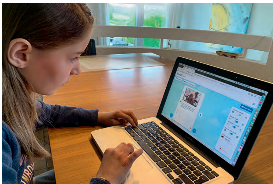
Eine Zweitklässlerin arbeitet konzentriert an ihrem Beitrag über ihren Tag als Detektivin.

Doch wie gut kann das Lesen und Schreiben über die digitalen Kanäle überhaupt gefördert werden? Verschiedene Studien haben in den letzten Jahren belegt, dass gerade das Lesen auf digitalen Geräten gegenüber dem Papier Nachteile birgt. So hat eine Studie der norwegischen Universität Stavanger 2018 festgehalten, dass das Textverständnis durch Bildschirmlesen geschwächt wird. Dennoch entstehen immer mehr digitale Tools, um Kinder und Jugendliche zum Lesen und